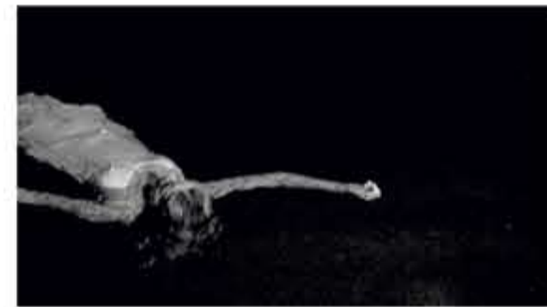
Zürich Dreikönigsbrücke, Unterführung Schanzengraben Vernissage 26. August 2006